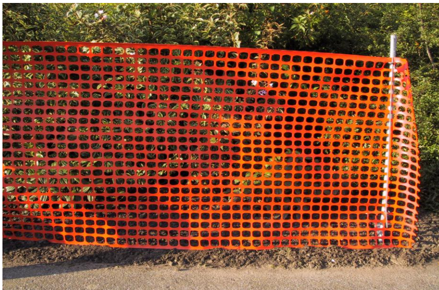
Afspærringsnet type F23 monteret i jordunderlag til afgrænsning mellem vej og rabat.

Ønsker man at undgå fygesne, kan nettet mindske mængden af fygesne, der passerer gennem nettet – og ønskes et endnu mere effektivt net, anbefales EXPO-NET's type 15/16.